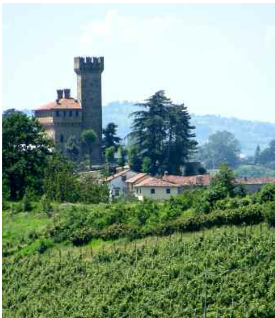
in alto: il castello di Gabiano