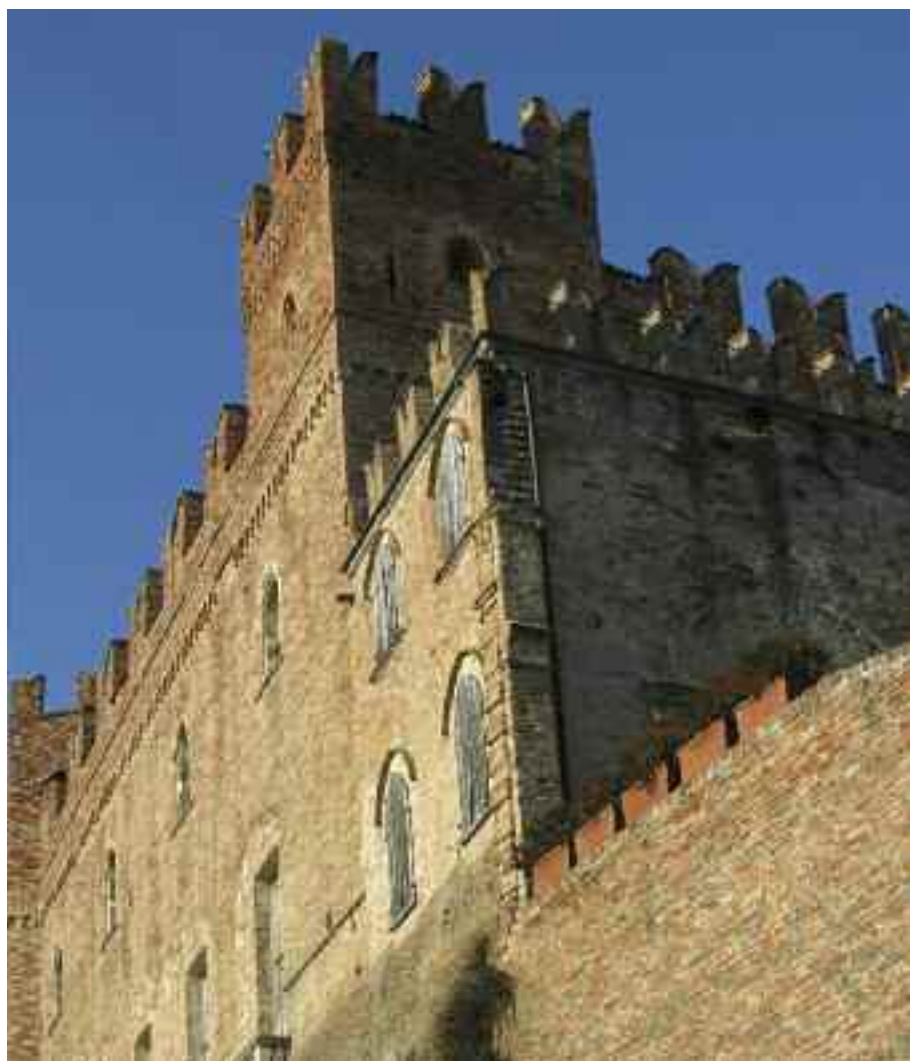
Castello di Montemagno