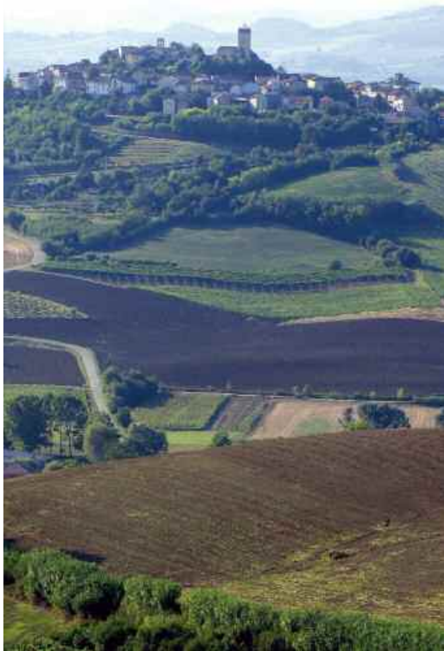
Panorama di Conzano dal belvedere di Lu