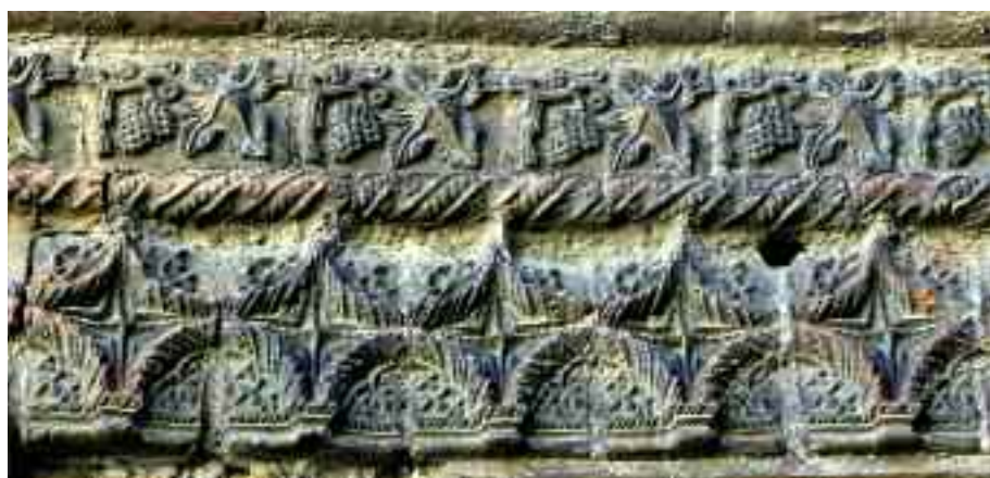
in alto: particolare del rosone della Chiesa di Santa Maria Assunta di Fubine in basso: fregio della casa detta dei Marchesi di Monferrato a Moncalvo