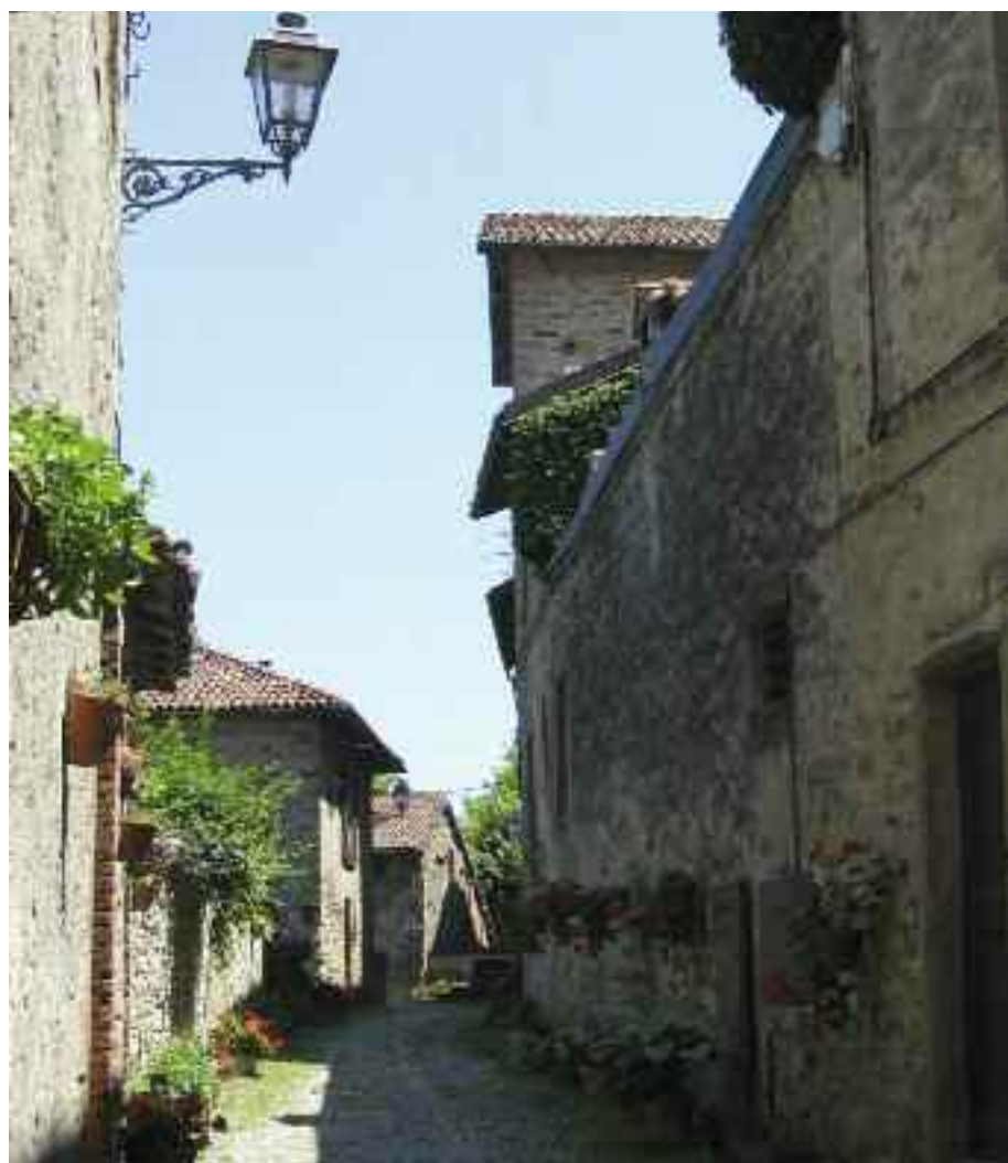
in alto: il ponte e il castello di Monastero Bormida [foto M. CARCIONE] in basso: il ricetta di Tagliolo Monferrato [foto M. CARCIONE]