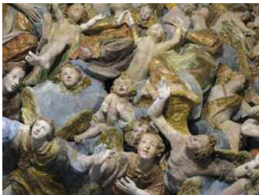
in alto: MAESTRO DI CREA, Guglielmo VIII Paleologo, la moglie, le figlie e personaggi della corte , Cappella di santa Margherita d'Antiochia, Santuario di Crea in basso: GIOVANNI E NICOLA TABACCHETTI, Particolare del Gruppo scultoreo con l'incoronazione della Vergine, gloria d'angeli e santi astanti , Cappella XXIII Incoronazione della Vergine detta il Paradiso , Santuario di Crea