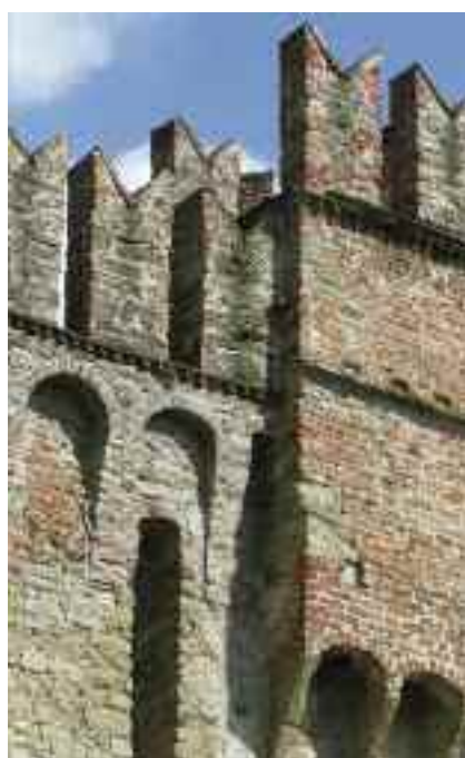
in alto: particolare dell'Abbazia di Vezzolano [foto M. CARCIONE] in basso: particolare di una colonna del cortile del Castello di Casale Monferrato [foto M. CARCIONE] – particolare delle mura del Castello di Cremolino [foto M. CARCIONE]