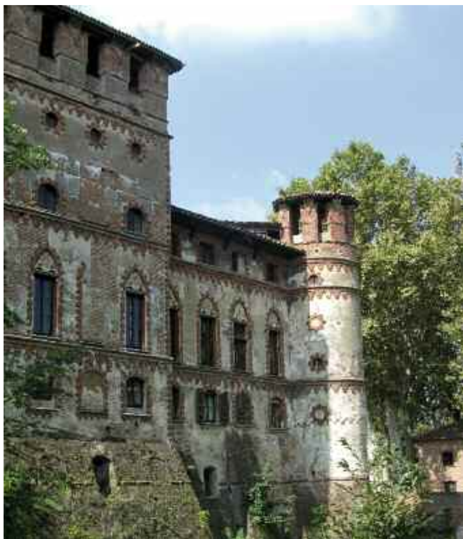
in alto: il Castello di Camino [foto M. CARCIONE] in basso: il Castello di Piovera [foto M. CARCIONE]